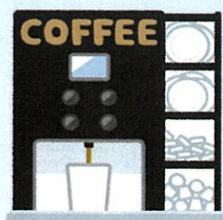
コーヒーマーカー