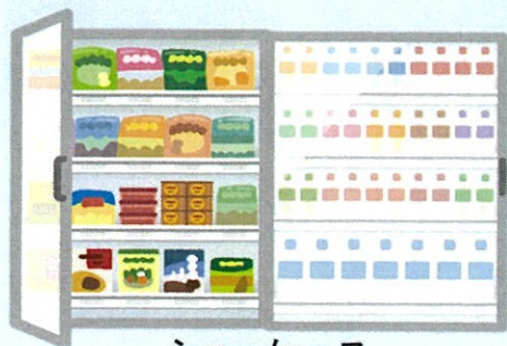
ショーケース 冷凍・冷蔵・保温